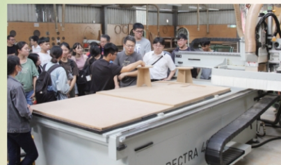
木材利用工廠接受企業捐贈1部CNC加工機

● 辦理海外職場專業實習每年選派大四下應屆畢業生，前往越南家具廠進行現場教學實習2~3個月，落實產學合一，學以致用，畢業即就業。