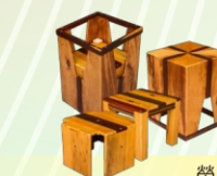
榮獲「2015廢棄木材創意競賽」全國第二名「聚。1>3」