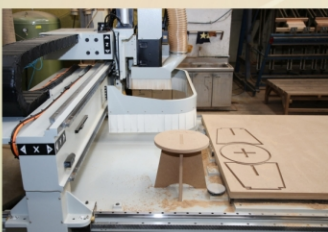
CNC加工機裝機完成後實際操作情形