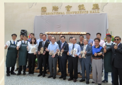
「木質層積材創意商品推廣發表會」推廣國產木材的好