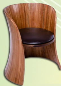
入選「2021臺灣工藝競賽」「正襟為座」